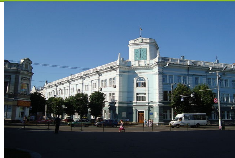
Житомир (современное фото)